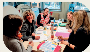
Action Vis ma vie - 2023