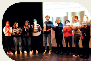
« Tous en scène avec les OT » 2 jours d'échanges et de partage autour des talents et expertises du réseau - 2023