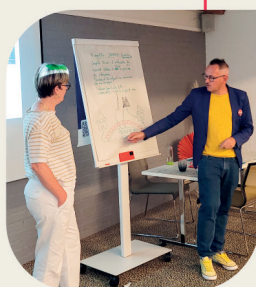
Atelier stratégie d'accueil et prestataires - OT Valenciennes Métropole 2023

Méthode et organisation libre à l'échelle de chaque groupe de travail